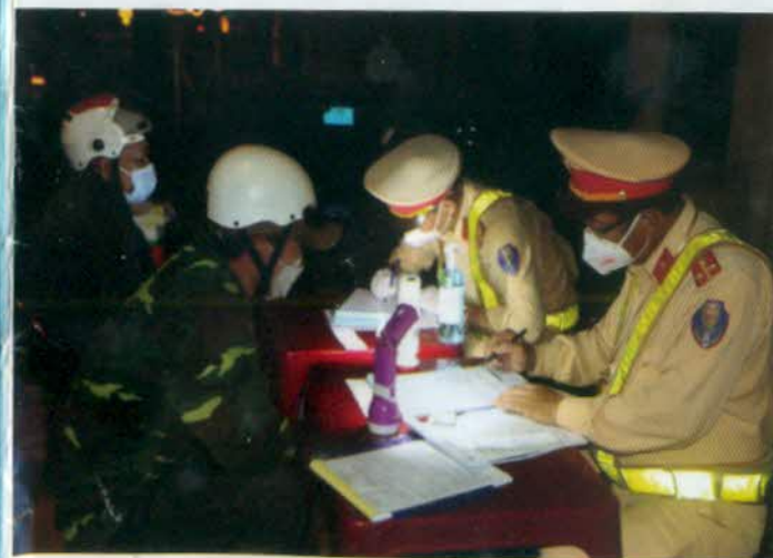
Lập biên bản vi phạm hành chính các trường hợp vi phạm Luật giao thông đường bộ