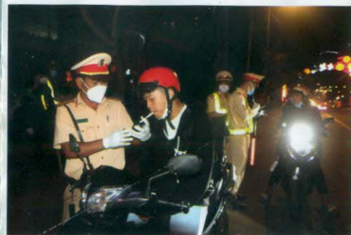
Đo nồng độ cồn đối với người điều khiển xe mô tô

- Phạt tiền từ 6.000.000 đồng đến 8.000.000 đồng đối với người điều khiển xe trên đường mà trong máu hoặc hơi thở có nồng độ cồn vượt quá 80 miligam/100 mililit máu hoặc vượt quá 0,4 miligam/1 lít khí thở. Tước quyền sử dụng GPLX từ 22 tháng đến 24 tháng, tạm giữ phương tiện đến 7 ngày.