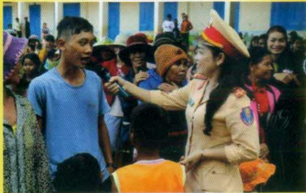
Tăng cường tuyên truyền Luật giao thông đường bộ cho người đồng bào dân tộc thiểu số vùng sâu, vùng xa của tỉnh Đắk Nông