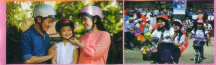
Trẻ em từ đủ 6 tuổi trở lên phải đội mũ bảo hiểm khi ngồi trên xe mô tô, xe gắn máy, xe đạp điện.

5. Phạt tiền từ 400.000 đồng đến 600.000 đồng đối với người điều khiển, người ngồi trên xe mô tô, xe máy không đội mũ bảo hiểm hoặc đội mũ bảo hiểm không cài quai đúng quy cách khi tham gia giao thông đường bộ (trừ trường hợp chở người bệnh đi cấp cứu, trẻ em dưới 06 tuổi, áp giải người có hành vi vi phạm pháp luật)